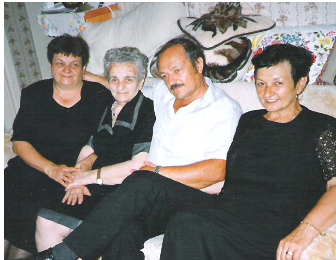
Édesanyámmal és testvéreimmel